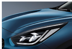
Deep Cerulean Blue (C3U) metallic