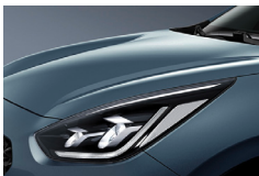
Horizon Blue (BBL) metallic