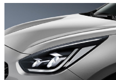
Silky Silver (4SS) metallic