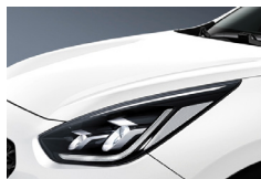
Snow White Pearl (SWP) metallic (pearleffekt)