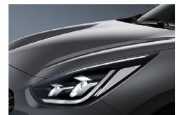
Platinum Graphite (ABT) metallic