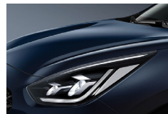
Gravity Blue (B4U) metallic