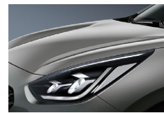
Steel Grey (KLG) metallic