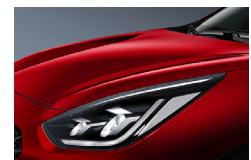
Runway Red (CR5) metallic

Kia Motors Sweden AB Kanalvägen 10A 194 61 Upplands Väsby Sverige Tfn: 08 - 400 443 00 www.kia.com